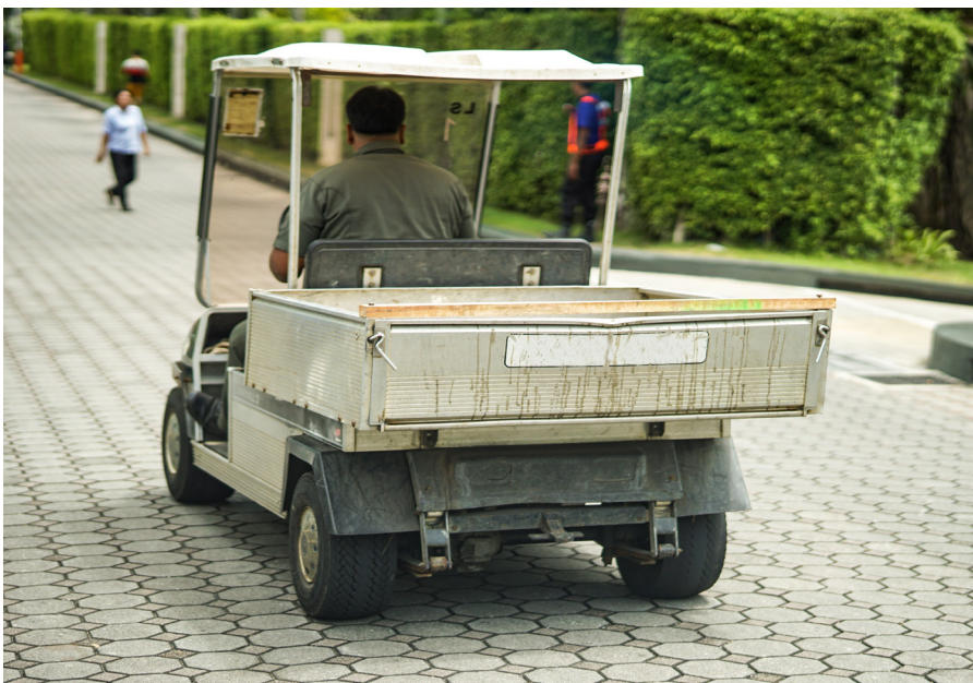
Tabla 1. Causas principales de las lesiones relacionadas con los carritos de golf en los Estados Unidos

Escriba una declaración de seguridad, fírmela y colóquela en un lugar donde todos puedan verla. Incluya políticas para manejar y mantener el equipo y asegúrese que los empleados operen los carritos de manera segura. Cuando la compañía muestra interés para prevenir accidentes y proporciona un área de trabajo segura, lo más probable es que los empleados hagan lo mismo.