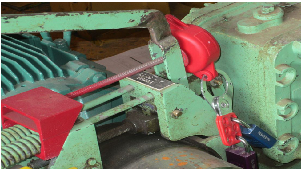
Un dispositivo de bloqueo aplicado a un freno de polipasto.

de Seguridad sobre el Bloqueo y Etiquetado de la Sección de Seguridad en el Área de Trabajo del Departamento de Texas de Seguros, División de Compensación para Trabajadores.